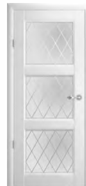
Эрмитаж-3 стекло «Ромб»