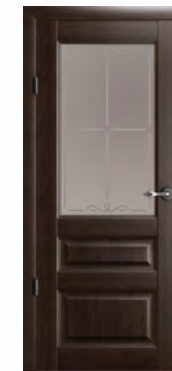
Эрмитаж-2 стекло «Галерея»