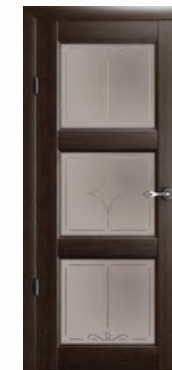
Эрмитаж-3 стекло «Галерея»