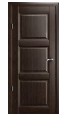
Эрмитаж-3 полотно глухое