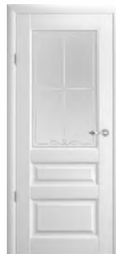
Эрмитаж-2 стекло «Галерея»