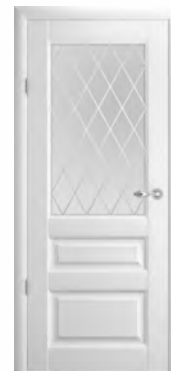
Эрмитаж-2 стекло «Ромб»