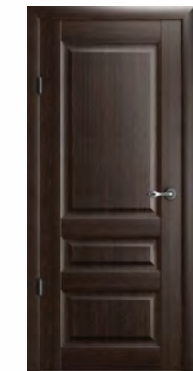
Эрмитаж-2 полотно глухое