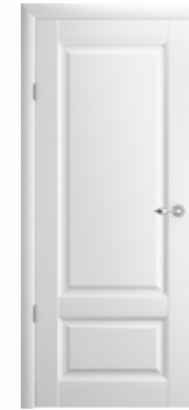
Эрмитаж-1 полотно глухое