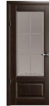
Эрмитаж-1 стекло «Галерея»