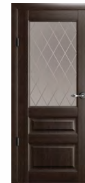
Эрмитаж-2 стекло «Ромб»