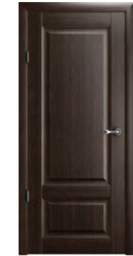
Эрмитаж-1 полотно глухое