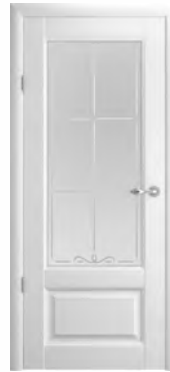
Эрмитаж-1 стекло «Галерея»

Благодаря новому сечению царги модели «Эрмитажа» выглядят очень элегантно и отлично дополняют классические интерьеры. Стекла в данных моделях так же изготавливаются из стекла «Мателюкс» с алмазной гравировкой.