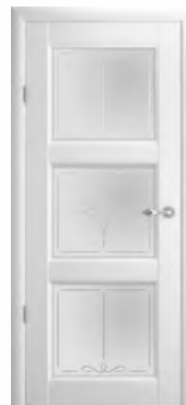
Эрмитаж-3 стекло «Галерея»