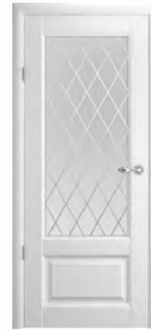
Эрмитаж-1 стекло «Ромб»