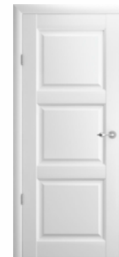
Эрмитаж-3 полотно глухое